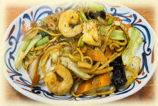
醤油炒め焼きそば ・・・ 800 円