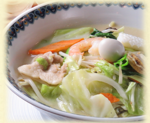
中ちゃんぽん・・・ 800 円