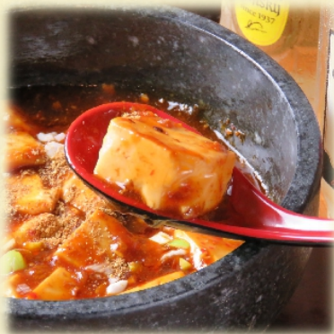
四川風麻婆豆腐・・・ 800 円