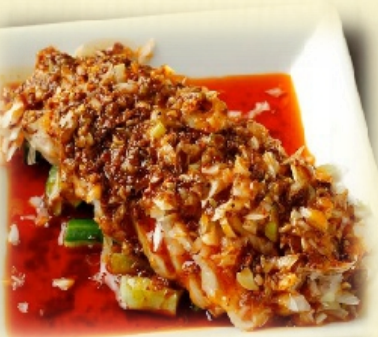
よだれ鶏・・・650円