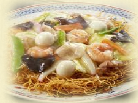
海鮮皿うどん ・・・ 800 円