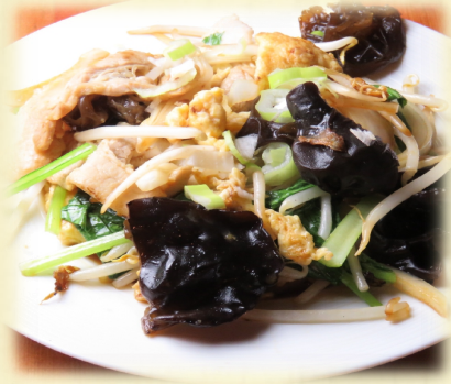
ムーシーロー・・・ 800 円

愛媛県大洲産の醤油をメインとしおり、 調味料は全て自家製。 松山らしい「甘く優しい味」をお召し上がりください。