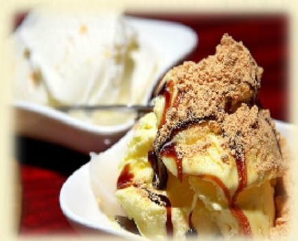
黒蜜きなこアイス