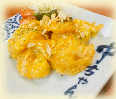
えびマヨ・・・700円