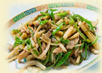
チンジャオロース定食