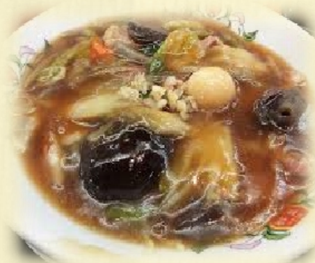
野菜たっぷり中華丼