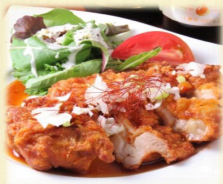
四川風油淋鶏・・・800円