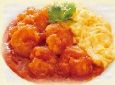
エビのチリソース・・・ 800 円